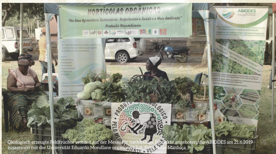
Ökologisch erzeugte Feldfrüchte werden auf der Messe für nachhaltige Produkte angeboten, die ABIODES am 21.6.2019 zusammen mit der Universität Eduardo Mondlane organisiert hat.

Umweltschutz sowie den Schutz natürlicher Ressourcen einsetzen. ABIODES ist landesweit in den Bereichen Landwirtschaft und Ernährungssicherheit, Umwelt und natürliche Ressourcen sowie Lobby und Advocacy tätig.